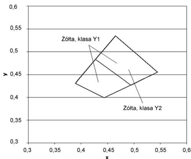
Rys.2. Współrzędne chromatyczności x,y dla barwy żółtej oznakowania