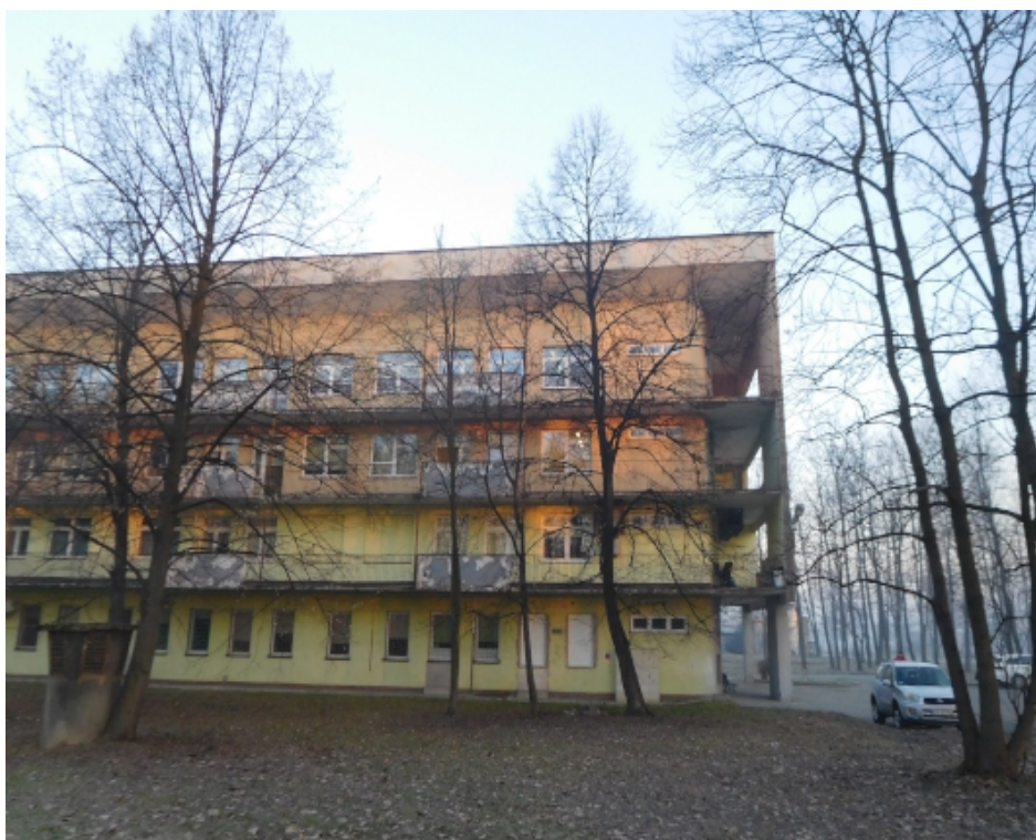
Fot. Budynek nr 3 – balkony,