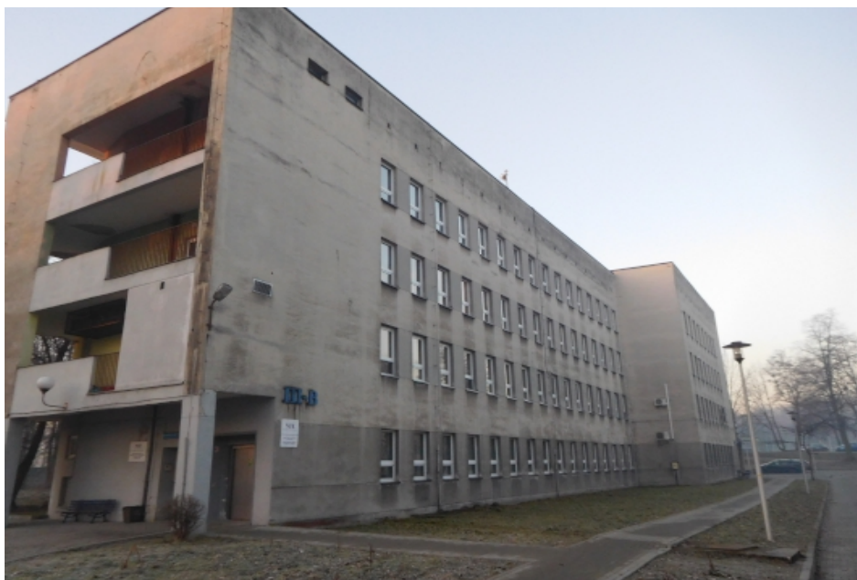
Fot. 1 Front budynku nr 3 ZOZ w Oświęcimiu