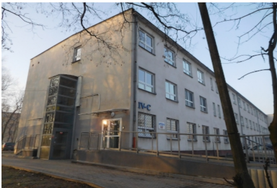
Fot. 1 Front budynku nr 4 ZOZ w Oświęcimiu