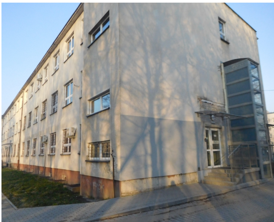
Fot. Budynek nr 3