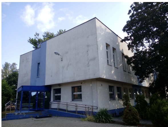
Widok elewacji frontowej budynku od strony wschodniej

Ściany budynku w poziomie parteru i I piętra wykończone zostały tynkiem strukturalnym, metodą lekką- mokrą, a jego cokół wyłożony płytkami ceramicznymi w kolorze niebieskim.