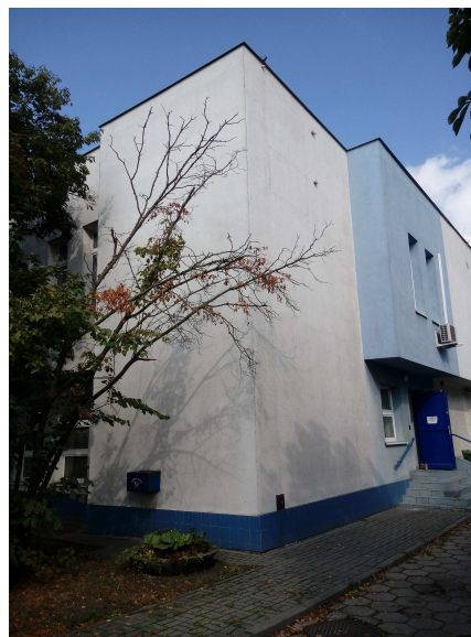
Widok elewacji frontowej budynku od strony zachodniej